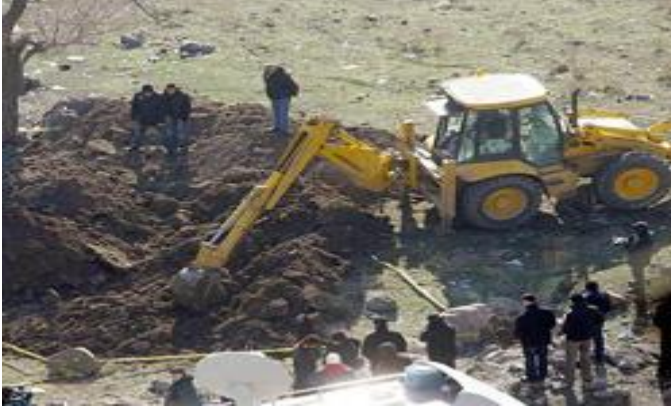
Şekil 14: Ergenekon Kazıları

Cemaat, geçmişte devlet içerisinde bazı kirlî işlere bulaşmış kişilerin de baskı ve şantaj yoluyla saf değiştirmesini sağlayarak, yaptırdıkları terör eylemlerinin, 'derin devlet' ile ilişkilendirilmesinin kolaylaştırılmasını sağlamışlardır.