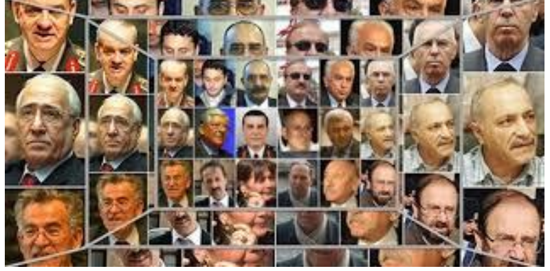
Şekil 3: Ergenekon Kumpas Davası Sanıkları