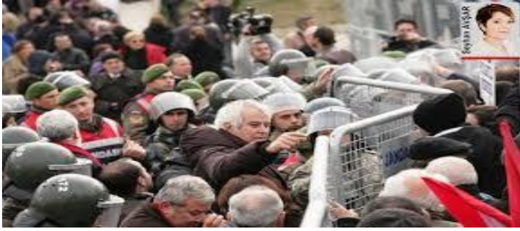
Şekil 10: Halk Desteği

Haberal, Mustafa Balbay, Doğu Perinçek'in de bulunduğu 64 sanığın 'Cebir ve şiddet kullanarak Türkiye Cumhuriyeti hükümetini ortadan kaldırmaya veya görevlerini yapmasını kısmen veya tamamen engellemeye teşebbüs' suçundan ağırlaştırılmış müebbet hapisle cezalandırılması istendi. Mütalaada, diğer sanıklar hakkında "Ergenekon terör örgütüne üye olmak" suçundan 7.5 yıldan 15'er yıla kadar hapis cezasıyla cezalandırılmaları talep edildi. Mütalaada, Eski İstanbul Büyükşehir Belediye Başkanı Bedrettin Dalan, eski Milletvekili Turan Çömez, Emekli Tümgeneral Mustafa Bakıcı ve Saipir Deblebidze'nin de firari sanık olması nedeniyle dosyasının ayrılması istendi.