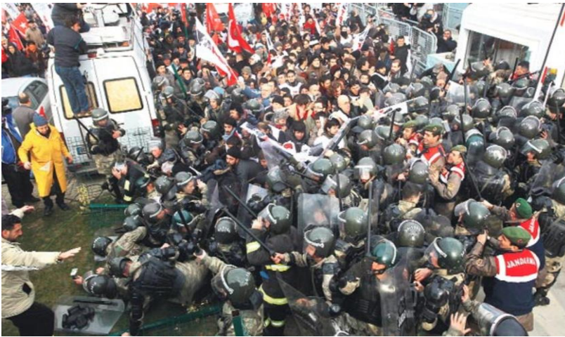
Şekil 11: Sıcak Duruşma

suçlaması bulunanlara da avukatlarıyla beraber mütalaaya ilişkin 1 saat savunma yapma süresi tanındı. Avukatlar da mahkemenin süre kısıtlamasına tepki göstererek, 15 Nisan 2013 tarihinde toplu olarak duruşmayı terk etti. Tutuklu ve tutuksuz sanıkların esas hakkındaki mütalaaya ilişkin savunmalarının alınması yaklaşık 2,5 ay sürdü. Savunmaların alınmasının tamamlanmasının ardından mahkeme heyeti, 21 Haziran 2013 Cuma günü duruşmada hazır olan 52 tutuklu sanığın son sözlerini alarak, yargılamaya son verdi.