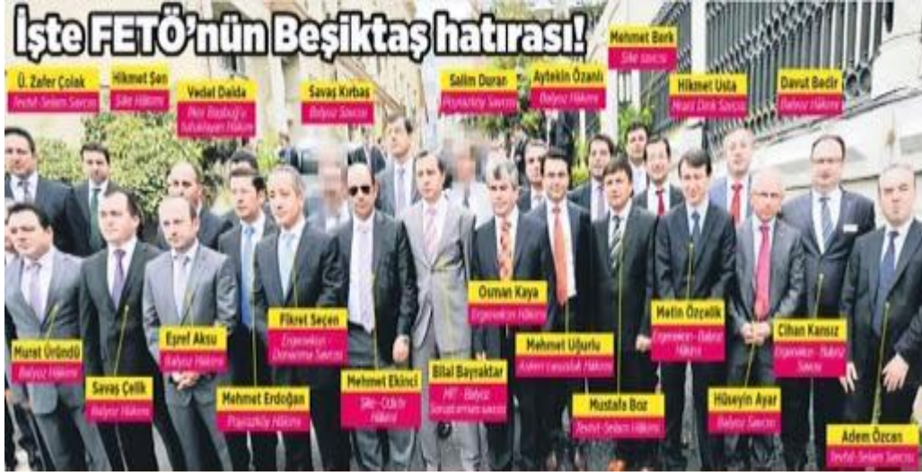
Şekil 17: FETÖ'nün Hakim ve Savcılar

anlaşılma, (A) ve (B) numaralı soruşturma maddelerindeki iddiaların sabit olduđu anlaşılmaştır.” denilmiştir.