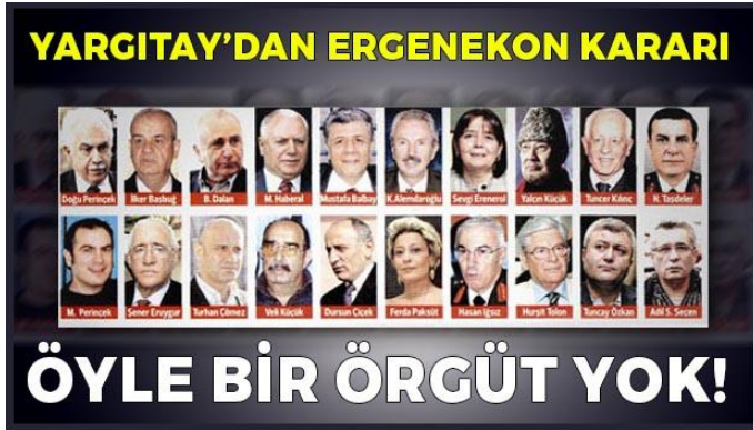
Şekil 16: Yargıtay Kararı

Davada yargılanan kişiler böyle bir örgütün olmadığını, adil yargılanmadıklarını, suç işlemediklerini, gerekmediği halde uzun süre tutuklu kaldıklarını, toplumun bir kesimine yönelik siyasi maksatlarla bu suçlamaların yöneltilip soruşturmaların yapıldığını anlatmışlardır. Uzun süren tutukluluk ve yargılama önemli bir sorun haline gelmiş kanun değişikliklerine rağmen tutukluluk durumları devam ettirilen kişiler ancak bireysel başvuru yolunu kullanarak anayasa mahkemesinin kararı ile tahliye edilebilmiştir.