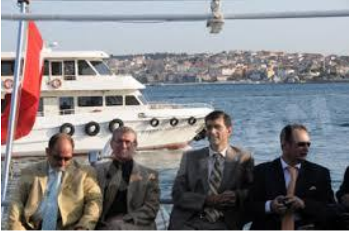
Şekil 5: Ergenekon Kumpas Davası Buluşması

Bilindiği gibi davanın üç aşaması var: Birinci aşaması İstanbul Emniyet İstihbarat Dairesi oluşturuyor. Emniyet İstihbarat Dairesi suç şüphesi olan kişi hakkında araştırma yapıyor. Topladığı delilleri savcılara götürüyor. Savcılar dosyayı inceledikten sonra operasyonu başlatıyor. Yakalananlar emniyet ve savcılıkta sorgulanıyor. Sorgulama sonucunda zanlılar mahkeme önüne çıkarılıyor. Mahkeme savcının iddialarını yeterli bulursa tutuklama kararını veriyor. Bu her dava için gerekli hukuku prosedür. Ergenekon Davası bu süreçle devam ediyor. Fakat bu davada ek bir durum yaşandığı ortaya çıkıyor.