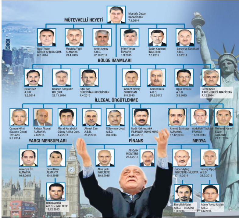
Şekil 13: Küresel Terör Örgütü FETÖ

Aslında Ergenekon Komplosunun temelleri, 1990'lı yılların ikinci yarısında cemaatin emniyet teşkilatı içerisinde gerçekleştirdiği Telekulak Operasyonunda atılmıştır. Bu operasyon cemaatin komplo yeteneğinin test edilmesi ve kendilerine güvenlerinin artmasına neden olmuştur. Telekulak Operasyonu, cemaatin kendilerini emniyet içerisinde soruşturan dönemin Ankara Emniyet Müdürü Cevdet Saral ve yardımcısı Osman