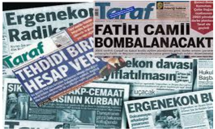
Şekil 4: Kumpas Davaları

alındığında varlığı Milli Güvenlik Siyaset Belgesinde de açıkça ortaya konulan FETÖ/PDY isimli silahlı terör örgütünün amaçları doğrultusunda ve belirli bir plan dâhilinde aşama aşama gerçekleştirildiği, soruşturma ve kovuşturma aşamalarında karşılaşılabilecek maniaların ve hukuki