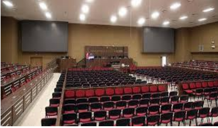
Şekil 6: Mahkeme Salonu