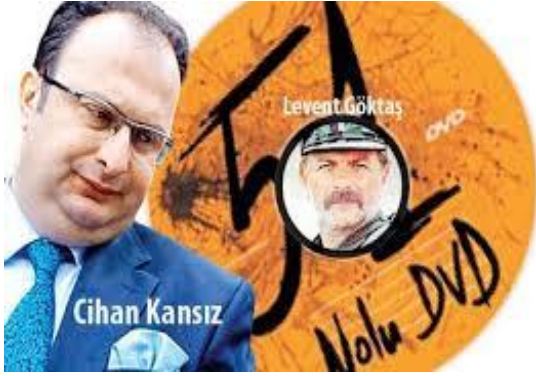
Şekil 7: 51 Nolu DVD

Bir diğer kritik delil 51 nolu DVD idi. 'Bazı yargı mensuplarının kişisel yaşamlarıyla ilgili elde ettiği görüntü kayıtlarını ihtiyaç duyulduğu zamanda onlara karşı tehdit ve şantaj amaçlı kullanmak üzere kaydedip sakladığı' suçlamasına sebep olan DVD, adli emanetteyken kırıldı. Üzerindeki parmak izlerinin silindiği