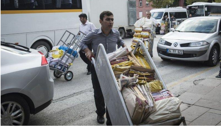
Şekil 2: Ergenekon Kumpas Davası Dosyaları

İlk iddianame 25 Ağustos 2008 tarihinde 2.455 sayfa olarak hazırlandı. İstanbul