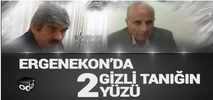
Şekil 8: Gizli Tanıklar

Dursun Çiçek'in parmak izi bulunamadı. Ancak sahibi sanıklardan hiçbiri olmayan 14 parmak izi çıktı. Belgenin askeri yazıma uymadığına dair 5 ayrı bilirkişi raporu yazıldı.