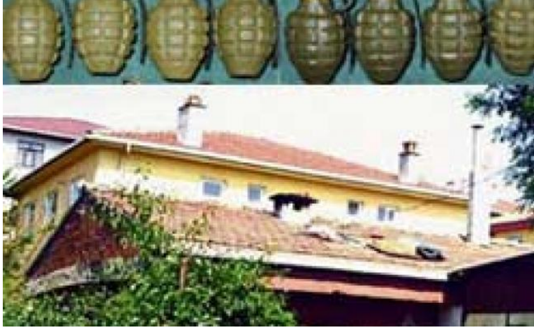
Şekil 1: Ümraniye Bombaları

Ergenekon Kumpas Davasının başlangıç tarihi olan 12 Haziran 2007 tarihinde Trabzon İl Jandarma Komutanlığı 156 jandarma imdat telefon hattına yapılan isimsiz ihbarda, İstanbul Ümraniye'de bulunan evin çatısında elektrik direğinin hemen yanında C-4 patlayıcı ve el bombaları olduğunun