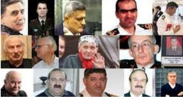
Şekil 9: Hayatını Kaybedenler