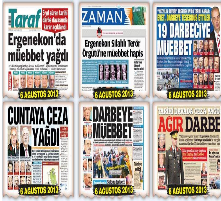
Şekil 12: Verilen Cezalar